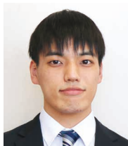
さんが 三ヶ 和歩 経営支援課