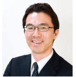
日本商工会議所 理事・事務局長 兼 産業政策第一部長 (元日本商工会議所 中小企業振興部長、元日本商工会議所 青年部顧問)