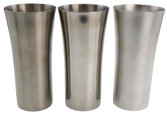
タンブラー無地(ステンレス)