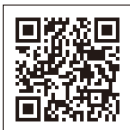
厚労省 労災リーフレット